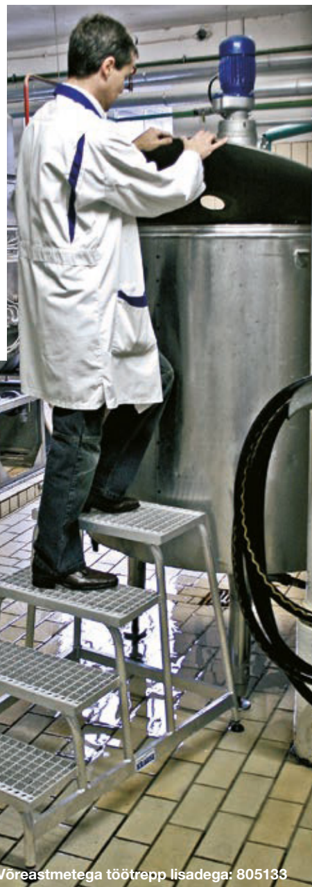
Võreastmetega töötrep lisadega: 805133

Ohutustarvikuna saadaval muudetava kõrgusega tellingujalg