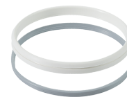
Vieser spetsiaalne kinnitusrõngas ja tihend