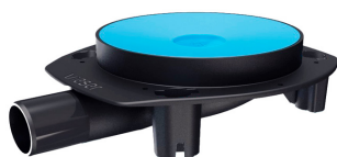
Vieser One kuivtrapp DN32/ 40