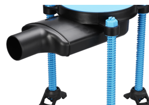
Vieser One horisontaalne trapp DN50 1x32, ekstra madal tugijalgadega