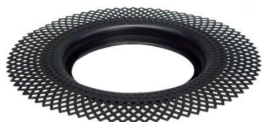
Vieser hüdroisolatsiooni krae