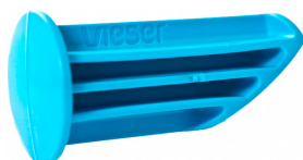
Vieser One'i külgliitmiku avamistööriist