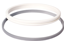
Vieser kinnitusrõngas ja tihend