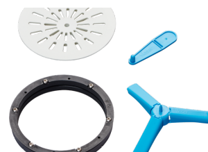
Vieser kruvidega kinnitav pingutusrõngas