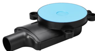
Vieser One horisontaalne trapp DN50 1x32 ekstra madal