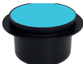
Vieser vertikaalne trapp DN50