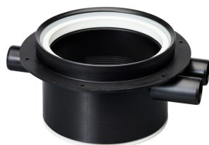
Vieser tõsterõngas külgevadega 3xDN32