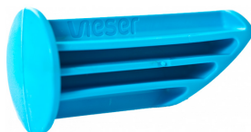
Vieser One'i külgliitmiku avamistöõriist