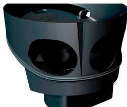
Vieser One põrandatrapivi spetsiaalne vesilukk