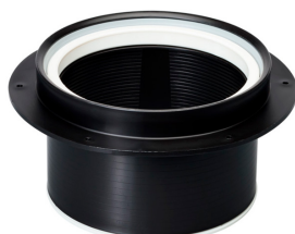
Vieser tõsterõngas 25-88mm