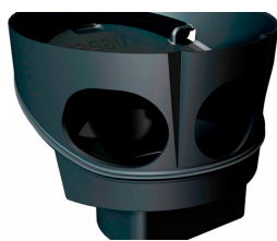
Vieser One vesilukk